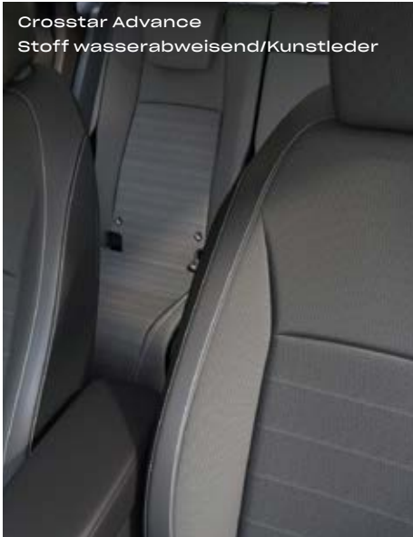
Crosstar Advance Stoff wasserabweisend/Kunstleder