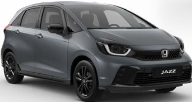
Urban Grey Pearl

Wir haben eine breite Palette an Farben kreiert, die perfekt zum stilvollen Jazz und zu Ihrem Lifestyle passen.