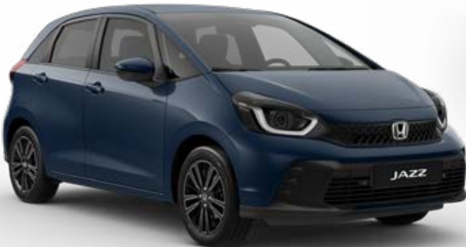
Seabed Blue Pearl