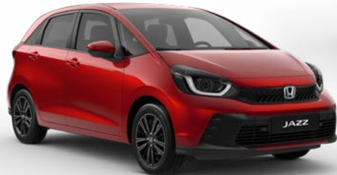
Premium Crystal Red Metallic