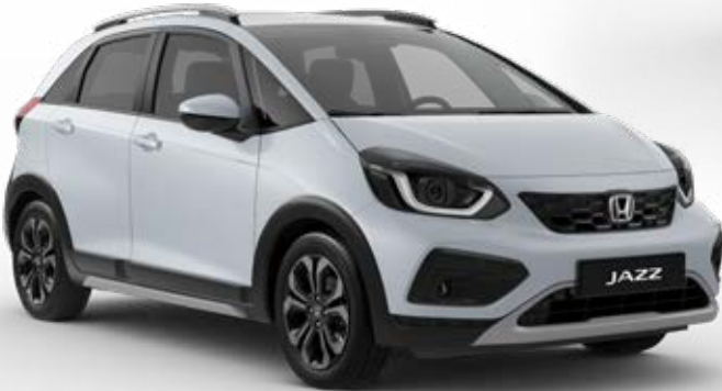
Premium Sunlight White Pearl