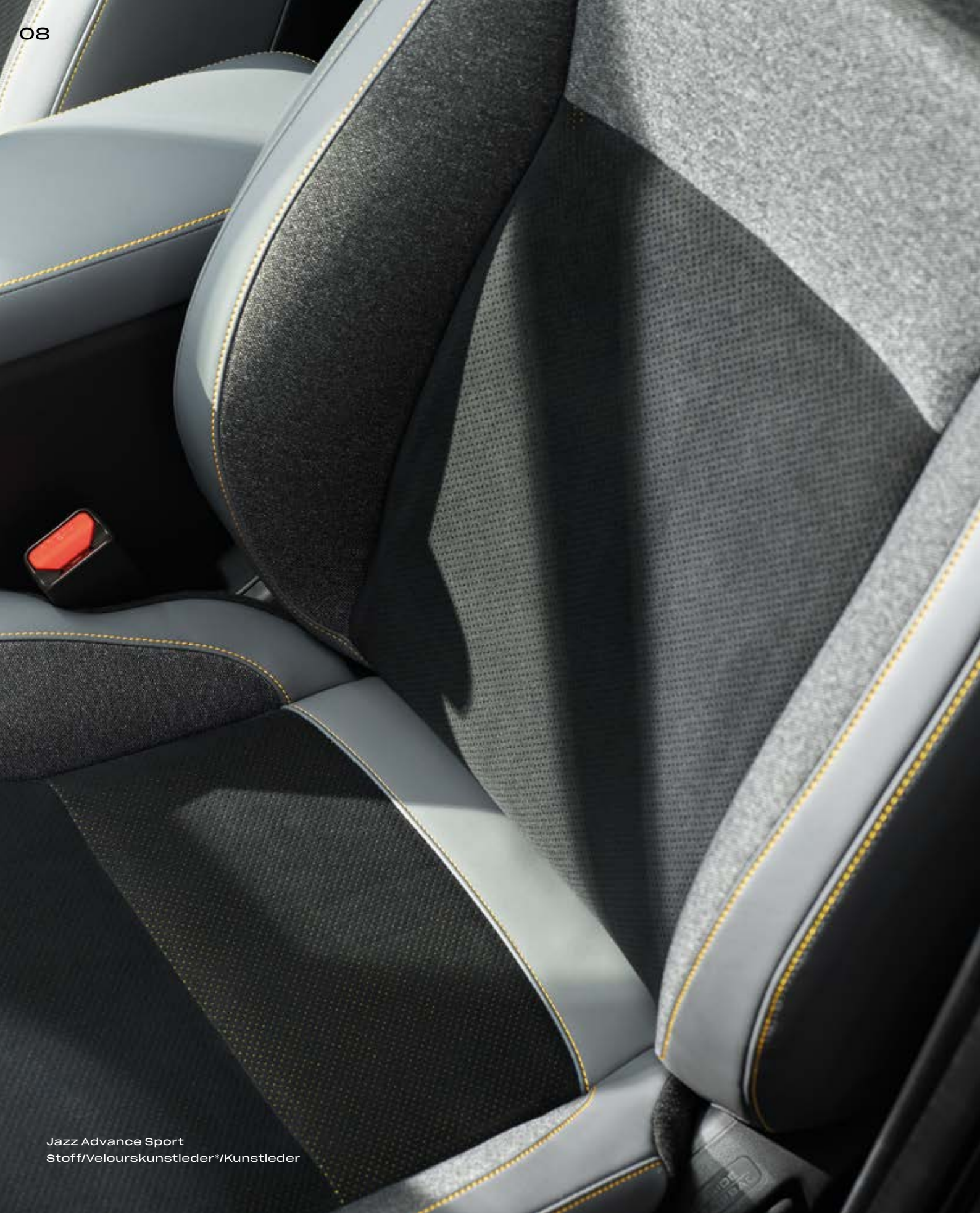
Jazz Advance Sport Stoff/Velourskunstleder*/Kunstleder