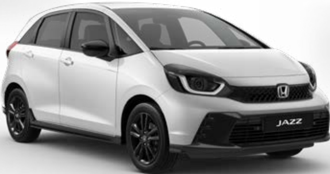
Platinum White Pearl