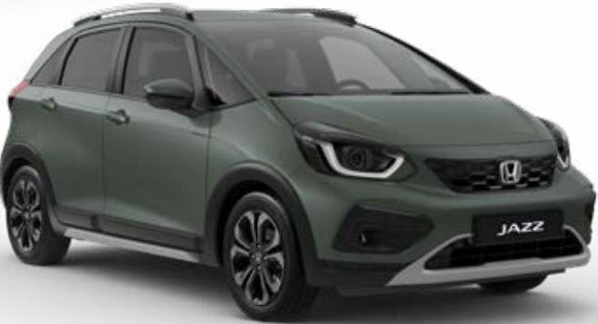
Sage Green Pearl