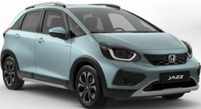
Fjord Mist Pearl