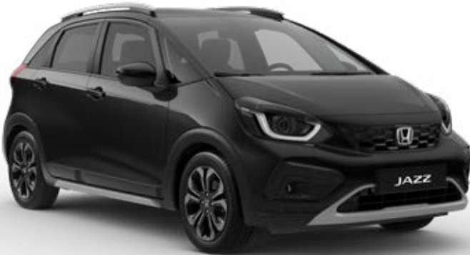
Crystal Black Pearl